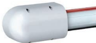
Uchwyt mocowania ramienia „S”