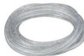
Listwa oświetleniowa LED