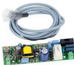
Zestaw połączeniowy oświetlenia ramienia