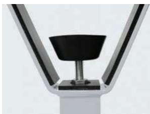
Regulowana śruba do uchwytu ramienia