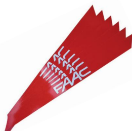
Naklejki na ramię